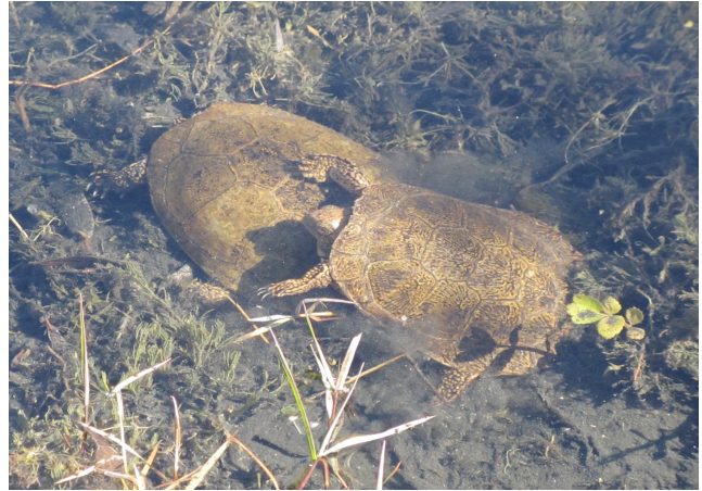
Figure 1. Mating Emys pallida from Arroyo Valladares, Sierra San Pedro Mártir, trying to escape after our approach.

Hatchlings observations. —On 23 April 2014, we observed a hatchling in Rancho El Potrero, Sierra San Pedro Mártir (30.9145°N, 115.6553°W; elevation 890 m, Fig. 3A). The hatchling measured CL = 31.2 mm; PL = 26.27 mm; and Wt = 6.7 g. It was found at 10:30 h in a shallow area of a small oxbow pond (70 m 2 , ~80 cm deep) located six meters from the main stream. The pond water was turbid, with felled logs, overhanging willows, and scarce aquatic vegetation. We observed two additional hatchlings in Arroyo San Rafael. The first individual (Fig. 3A) was found on 16 April 2015, ~32 km E of Colonet (31.11746°N, 115.88538°W, elevation 311 m). The hatchling (CL = 36