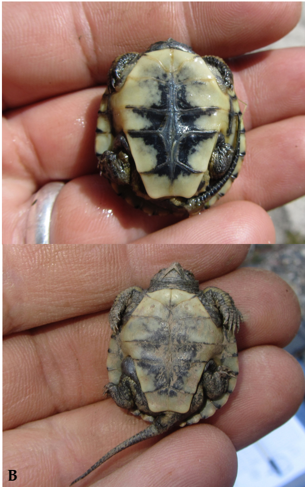
Figure 3. Hatchlings observations at El Potrero (A) and Arroyo San Rafael (B).

salicifolia in the direction of a pond, about three meters from the shore.