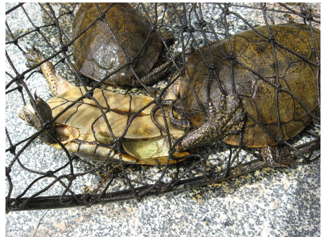
Figure 2. Copulating Emys pallida in a hoop net trap from Arroyo San Antonio Murillos, Sierra San Pedro Mártir.

mm; PL = 19.56 mm; and Wt = 8.3 g) was found at 19:25 h in a small pond (27 m 2 , 70 cm deep) located five meters from the main stream, in an area with dense willow trees ( Salix lasiolepis ) and mule-fat ( Baccharis salicifolia ). We found the second individual on 07 November 2015, 23 km E of Colonet (31.11894°N, 115.97145°W, elevation 210 m, Fig. 3B). This hatchling (CL = 23.5 mm; PL = 19.56 mm; Wt = 2.8 g) was found at 13:55 h walking on the ground among B.